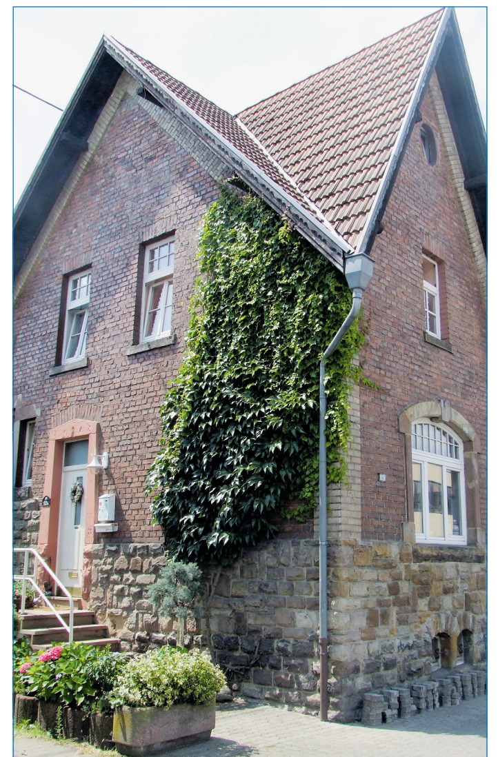
Ansehnliche Tradition: Glasmacherhaus in Fenne

diesem Konzept kann dann die Aufnahme in das Städtebauförderprogramm „Stadtumbau West“ beantragt werden.