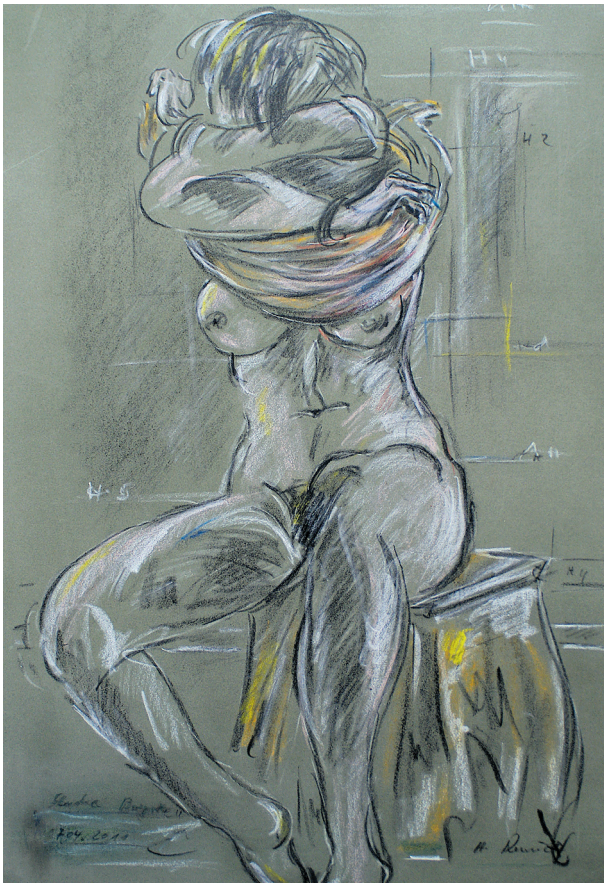
Bildtitel: „Studie Birgit“

Völklinger Stadtnachrichten Herausgeber: Stadt Völklingen Oberbürgermeister Klaus Lorig Rathausplatz, 66333 Völklingen Für unverlangt eingesandte Artikel übernimmt die Redaktion keine Haftung.