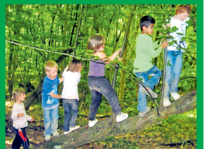
Sinneserfahrungen im Wald