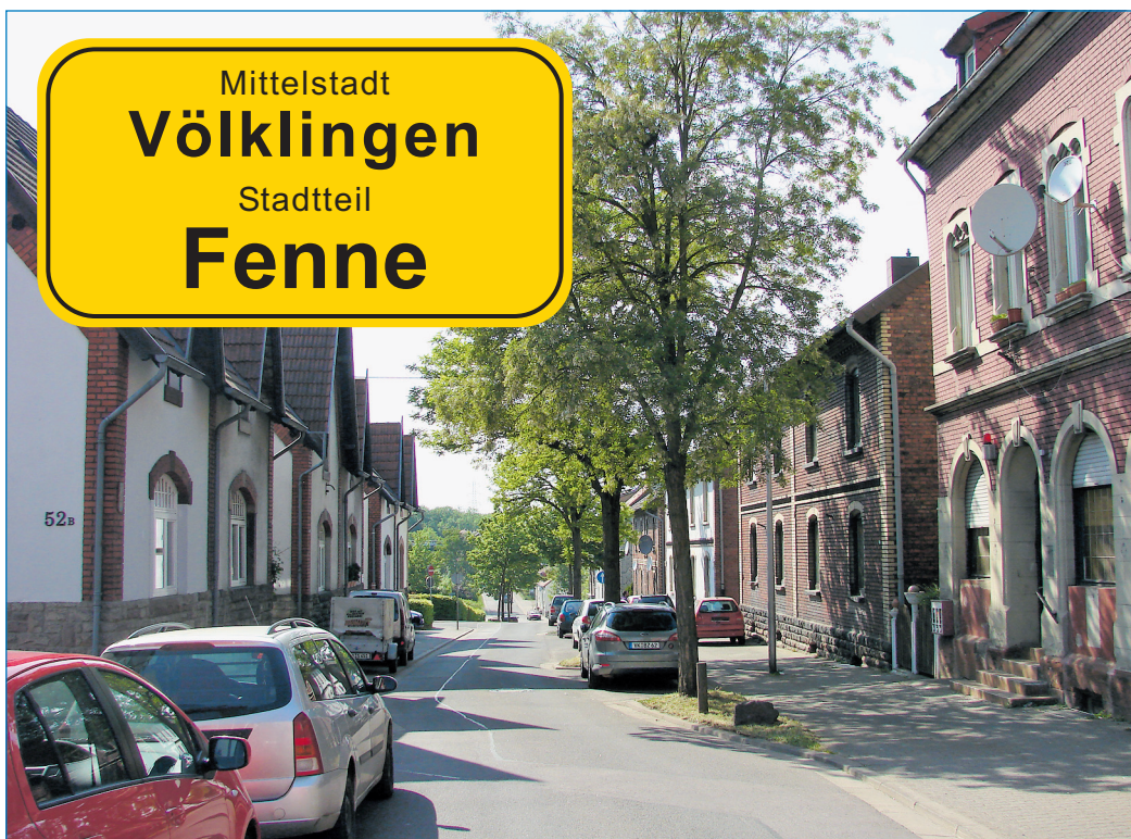
Ein Ziel des Stadtteilentwicklungskonzeptes: die Potentiale des Stadtteils als Wohnort stärker zu nutzen. Unser Bild zeigt die Hausenstraße.

wurden und Anfang dieses Jahres ein Stadtteilentwicklungskonzept für Luisenthal beschlossen wurde, soll nun auch der Stadtteil Fenne auf Grundlage einer solchen Untersuchung vorangebracht werden. Mit der Erarbeitung des Stadtteilentwicklungskonzeptes wurde das Illinger Ingenieurbüro Kernplan bereits im letzten Jahr beauftragt. Ergebnis-