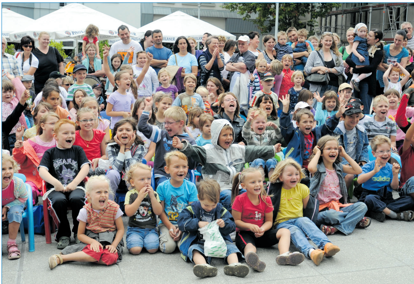
Bringen jedes Jahr ein Lachen in die Gesichter der kleinen und großen Zuschauer: die Vorstellungen der Reihe „Klamauk unterm Schirm“.

Klaus Lorig Oberbürgermeister der Stadt Völklingen